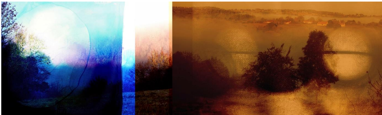
« Une nuit il faisait jour » - série « Séquence de mémoire », photographies et dessins, montage