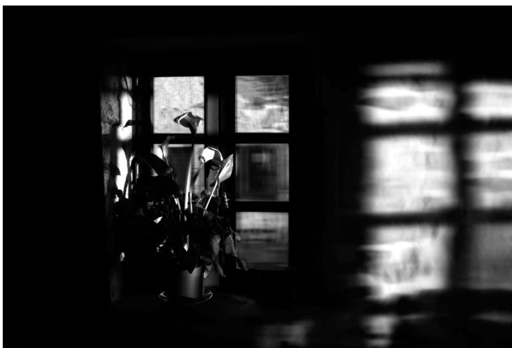
« Lumière dans la maison 12 », série « instants quotidiens et matière noire », photographie