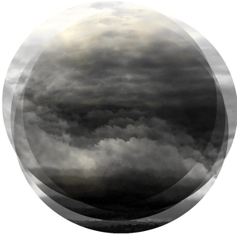
«Point de vue désaxé 1 », série « Les paysages matières », photographies superposées